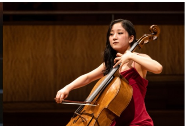
INGANINI Le Streghe op. 8

Halve finale 2024 : SongHa Choi - recital